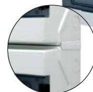
RH sestava - verze kombinovaná